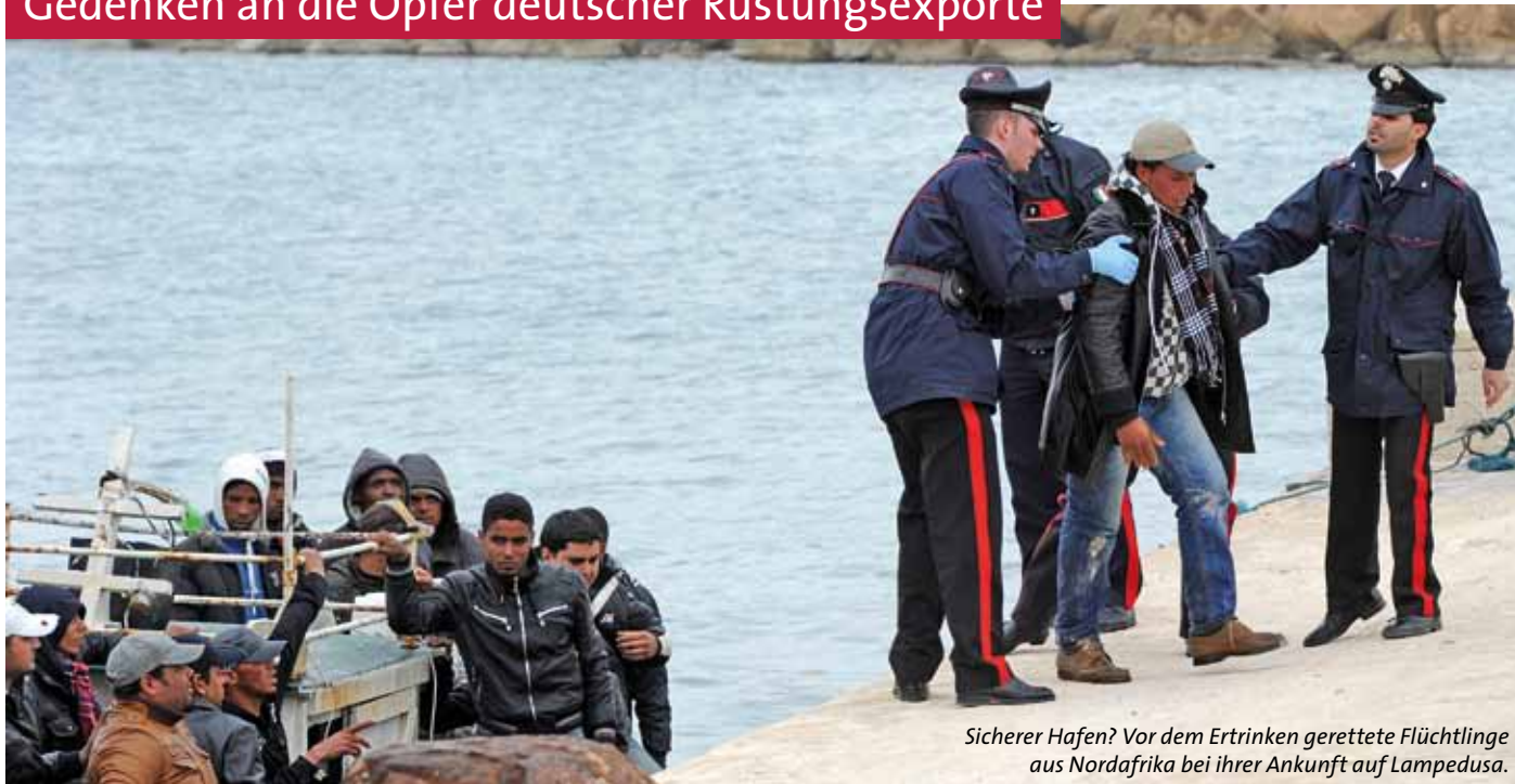
Sicherer Hafen? Vor dem Ertrinken gerettete Flüchtlinge aus Nordafrika bei ihrer Ankunft auf Lampedusa.

Frühjahr 2011 – in Nordafrika kämpft ein brutaler Diktator um seinen Machterhalt und scheut nicht den Einsatz massiver Waffengewalt gegen sein eigenes Volk. Der »Arabische Frühling«, der in Tunesien und Ägypten und weiteren Staaten des Nahen Ostens die Demokratiebewegung erblühen lässt, scheint auch Libyen, Syrien und den Jemen ergriffen zu haben.